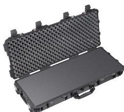
1700WF With Foam