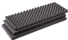
1701FS Juego de 3 piezas de espuma de recambio