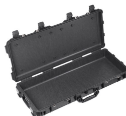
1700NF No Foam