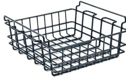
WBSM Cesta de rejilla de secado