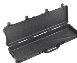
1750NF No Foam