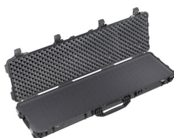
1750WF With Foam