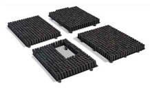
1750PRS RE-SET Kit