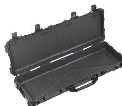
1720NF No Foam