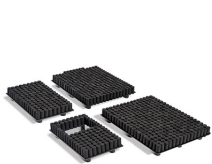
1720PRS RE-SET Kit