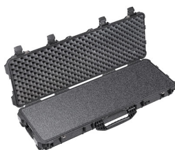
1720WF With Foam