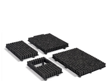
1720PRS RE-SET Kit