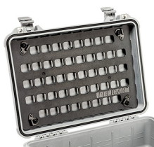
1500MP EZ-Click™ MOLLE Panel