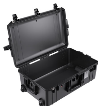
1595NF No Foam