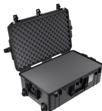
1595WF With Foam