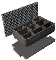
1595TPKIT Kit de divisores TrekPak