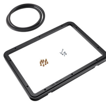
1400PF Panel de adaptación para aplicación especial