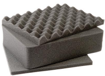
1401 Juego de 3 piezas de espuma de recambio