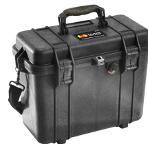
1430NF No Foam