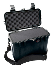
1430WF With Foam