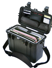
1437 With Padded Office Divider Set & Lid Organizer