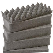
1431 Juego de 5 piezas de espuma de recambio