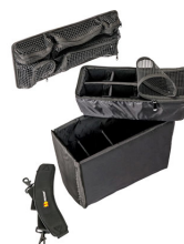
1435 Divisores acolchados