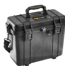
1430NF No Foam