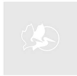
AL3022-0705RPFC With Foam, With Casters