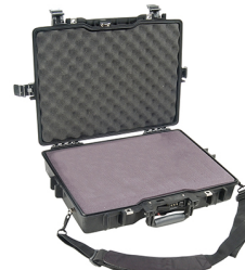
1495WF With Foam