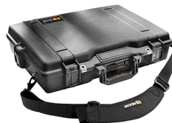
1495NF No Foam