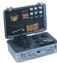
1508 Organizador de tapa para material de fotografía