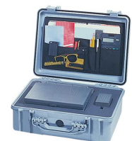
1509 Organizador de tapa