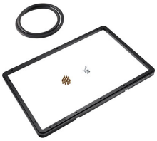
1500PF Panel de adaptación para aplicación especial