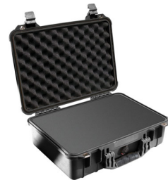
1500WF With Foam