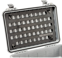
1500MP EZ-Click™ MOLLE Panel