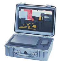
1509 Organizador de tapa