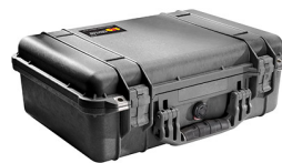
1500NF No Foam