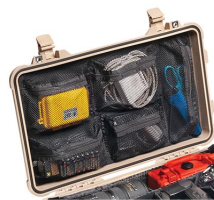
1519 Organizador de tapa