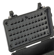
1510MP EZ-Click™ MOLLE Panel