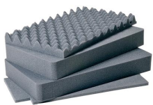
1511 Juego de 4 piezas de espuma de recambio