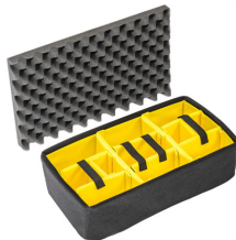
1515 Divisores acolchados