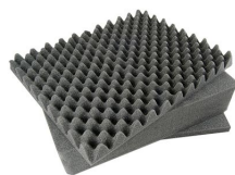
1521 Juego de 3 piezas de espuma de recambio