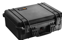
1520NF No Foam