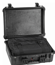
1526 With Convertible Travel Bag