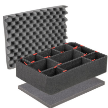
1520TPKIT Kit de divisores TrekPak