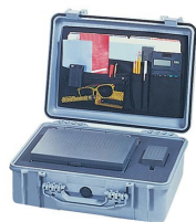
1509 Organizador de tapa