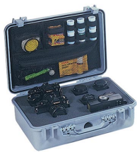
1508 Organizador de tapa para material de fotografía