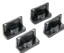
1507QM Soportes de montaje rápido - juego de 4