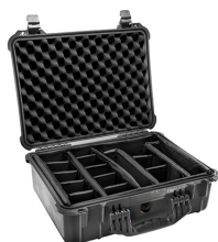
1524 With Padded Dividers