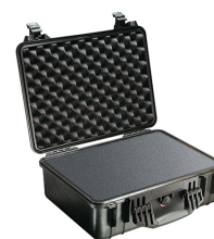
1520WF With Foam