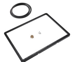
1550PF Panel de adaptación para aplicación especial