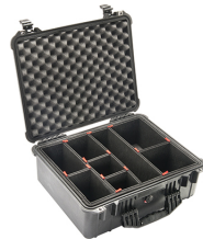
1550TP With TrekPak Divider System