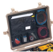
1609 Organizador de tapa