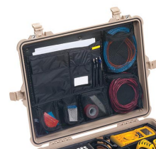
1609 Organizador de tapa