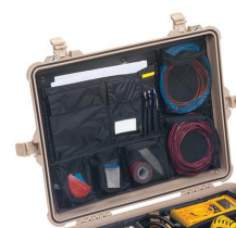
1609 Organizador de tapa