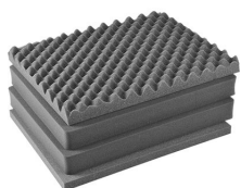
1601 Juego de 4 piezas de espuma de recambio