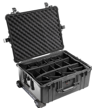
1614 With Padded Dividers