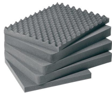
1611 Juego de 5 piezas de espuma de recambio