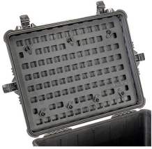
1610MP EZ-Click™ MOLLE Panel