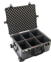
1610TP With TrekPak Divider System