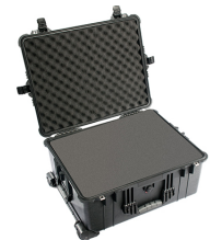
1610WF With Foam