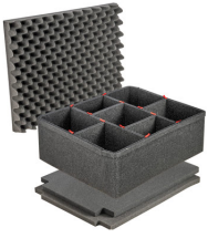
1610TPKIT Kit de divisores TrekPak