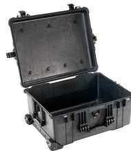
1610NF No Foam