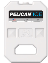
PI-2LB 2lb Ice Pack