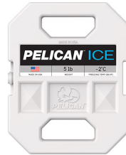
PI-5LB 5lb Ice Pack