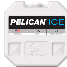
PI-1LB 1lb Ice Pack