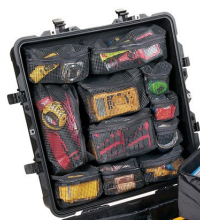
0379 Organizador de tapa