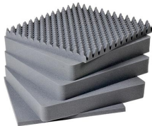
1641 Juego de 5 piezas de espuma de recambio