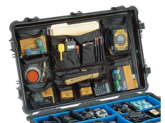
1659 Organizador de material fotográfico/tapa