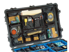
1659 Organizador de material fotográfico/tapa