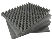
1651 Juego de 4 piezas de espuma de recambio