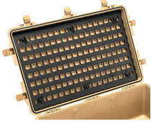
1650MP EZ-Click™ MOLLE Panel