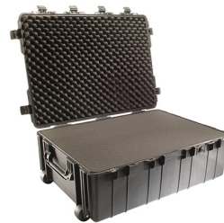
1730WF With Foam