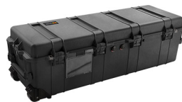
1740NF No Foam