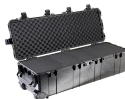
1740WF With Foam