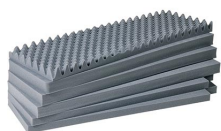
1741 Juego de 6 piezas de espuma de recambio