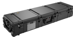
1770NF No Foam