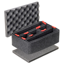
1120TPKIT Kit de divisores TrekPak