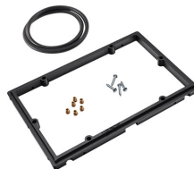
1120PF Panel de adaptación para aplicación especial