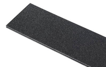
1120TPDIV Extra TrekPak Dividers