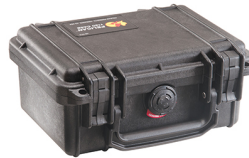
1120NF No Foam