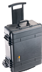
1560MNF No Foam