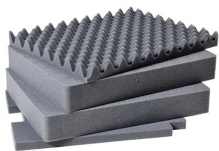
1561 Juego de 4 piezas de espuma de recambio