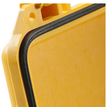
0343 Junta tórica de repuesto