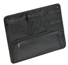
1569 Organizador de tapa