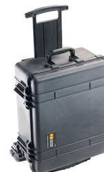
1560MWF With Foam