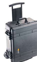
1560MWF With Foam