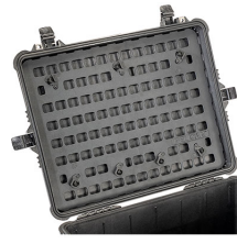
1610MP EZ-Click™ MOLLE Panel