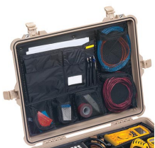
1609 Organizador de tapa