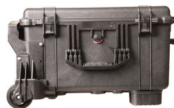
1620WF With Foam