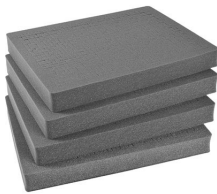
1622 Pick N Pluck™ Sections Only (set of 4)