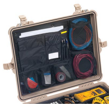
1609 Organizador de tapa