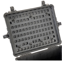
1610MP EZ-Click™ MOLLE Panel