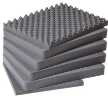
1621 Juego de 6 piezas de espuma de recambio