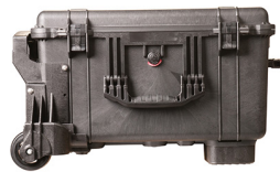
1620MNF No Foam