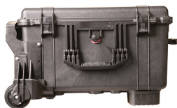
1620MNF No Foam