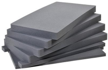
1781 Juego de 6 piezas de espuma de recambio