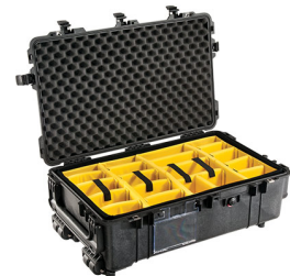
1674 With Padded Dividers