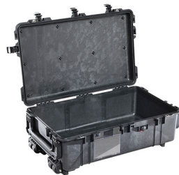
1670NF No Foam