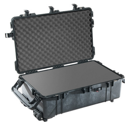
1670WF With Foam