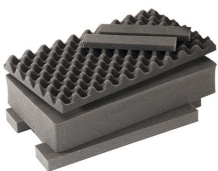
1535AirFS Juego de 5 piezas de espuma de recambio