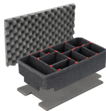
1535TPKIT Kit de divisores TrekPak