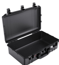
1555NF No Foam