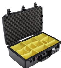
1555WD With Padded Dividers