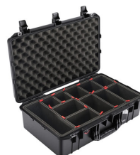
1555TP With TrekPak Divider System