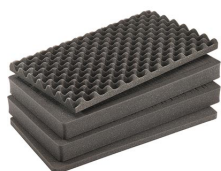
1555AirFS Juego de 4 piezas de espuma de recambio