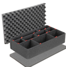
1555TPKIT Kit de divisores TrekPak