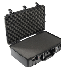
1555WF With Foam